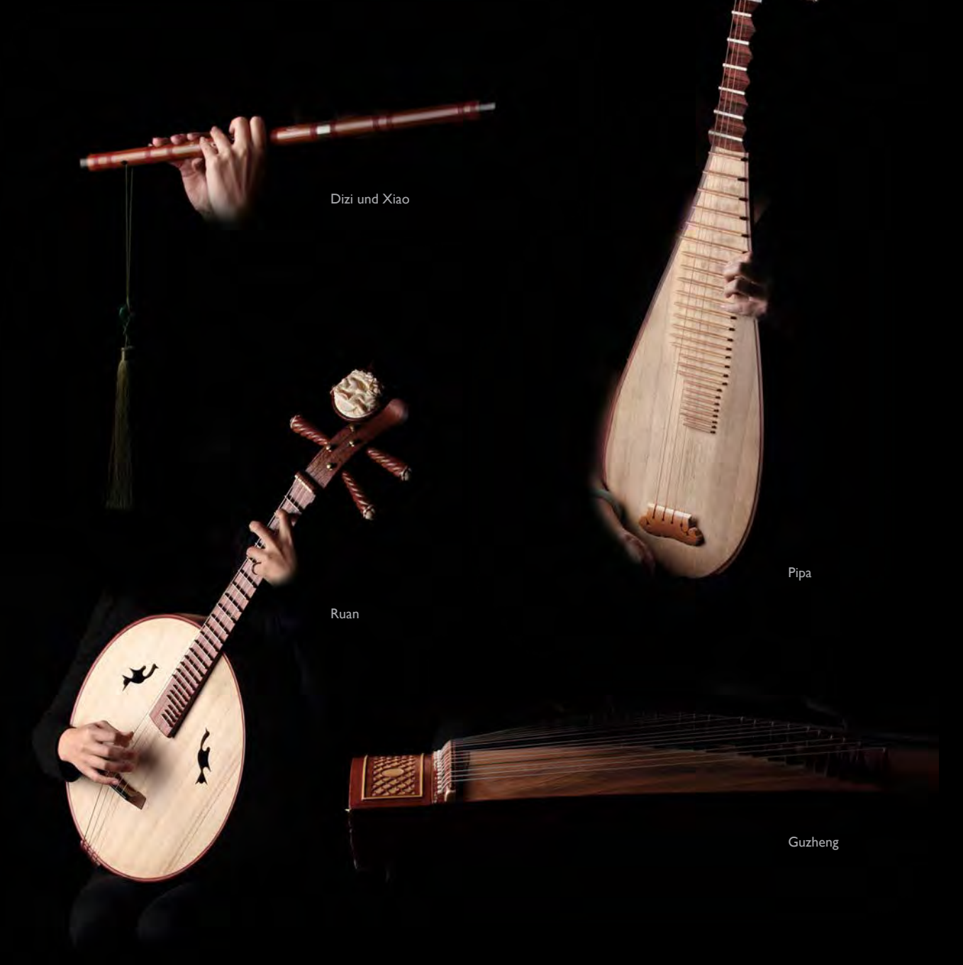
Dizi und Xiao