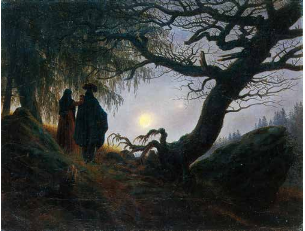
Mann und Frau den Mond betrachtend (um 1824)

hierbei einen bedeutsamen Part, was schon auf Wolfs spätere Lieder vorausweist. Einerseits bewegter, vor allem aber äußerst selbständig gegenüber dem Sänger, erklingt hier erneut das Vor- bzw. Nachspiel, nun aber in lauten Fortissimo-Akkorden hinein. Bedeutsam ist zudem die lange pianistische Überleitung in das abschließende Lied hinein. Unglaublich modulierende, dabei abwärtsrückende Akkordketten des solistischen Klaviers, faszinieren hier, auch in der Art, wie sie zugleich in die äußerste Stille des Schlussliedes überleiten.