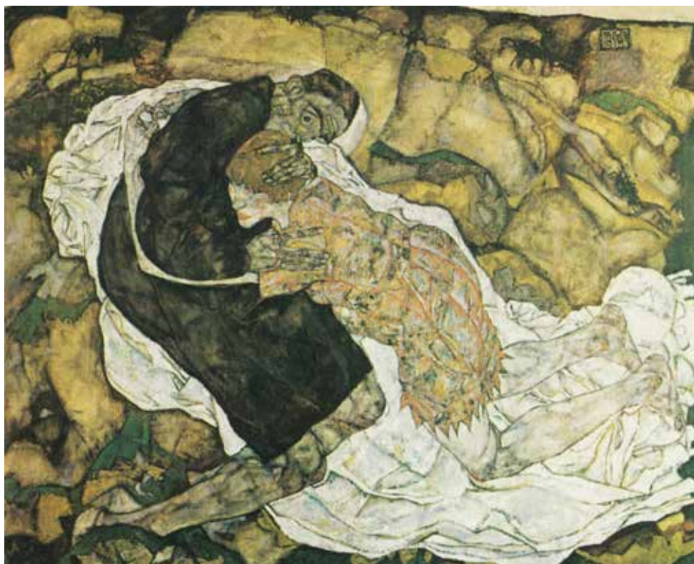
Egon Schiele: Tod und Mädchen (1915)

als Bühnen-Duett. Prägend ist gleich am Anfang ein Klopf-Rhythmus – das Anklopfen an die Kammertür des Mädchenzimmers. Im dritten Duett „ Es rauschet das Wasser “ vertont Brahms ein ursprüngliches Singspiel-Duett Goethes (aus: Jery und Bätely). Während das Bauernmädchen Bätely die Vergänglichkeit der Liebe betont, hält der treuherzige Jery ihr den Gedanken der Beständigkeit entgegen. Der anfänglich je solistische Gesang, verzahnt sich so zuletzt auf besondere Weise.