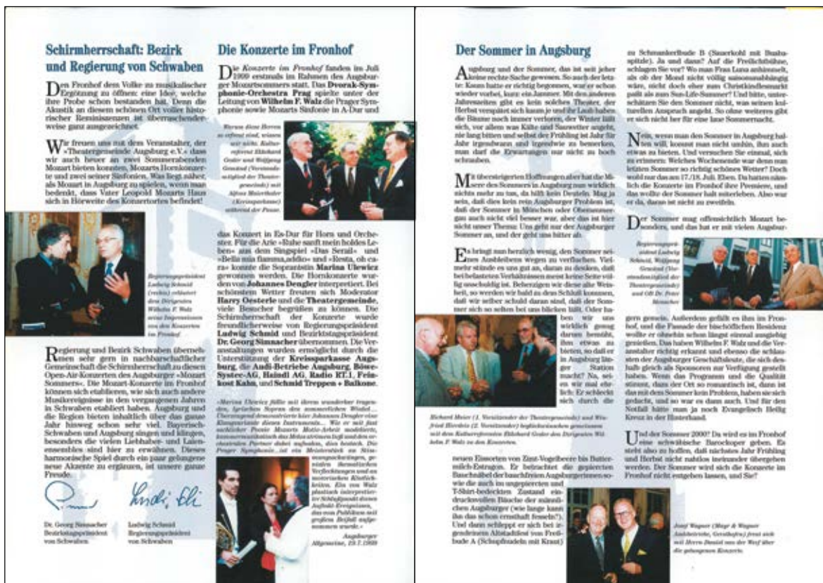
Aller Anfang war schwer – aber schön! Impressionen der Konzerte im Fronhof 1999

Künstlerischer Leiter der KONZERTE IM FRONHOF e.V.