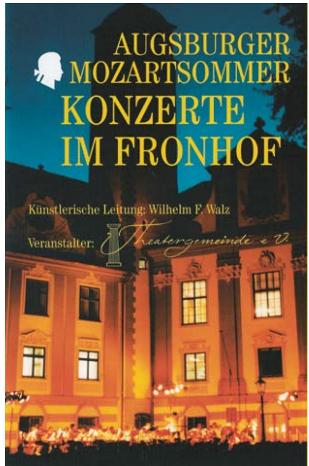
Das allererste Konzert 1999

Was, schätzen Sie, ist der wöchentliche Zeitaufwand von Ihnen und des dreiköpfigen Vorstands im Fronhof-Konzerte-Verein, damit die Konzerte an einem langen Wochenende des Jahres stattfinden können?