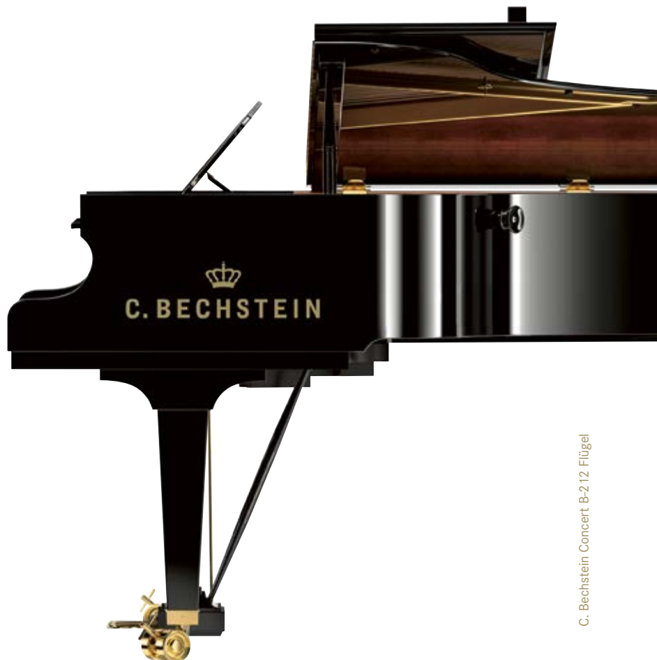
C. Bechstein Concert B-2.12 Flügel

Sehr gerne unterstützen wir diese Konzertreihe und die Arbeit von KONZERTE IM FRONHOF mit aufstrebenden, internationalen Künstlern.