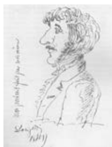
Gaetano Donizetti – „Mein Selbstportrait“

mit dem allmächtigen Impresario Barbaja einen Vertrag, in drei Jahren zwölf Opern für ihn zu schreiben. In einem Brief aus dem Jahr 1825 nimmt Donizetti deutlich zur damaligen Situation des Opernbetriebes Stellung: „Ich habe von Anfang an begriffen, dass der Beruf des Opernschreibers außerordentlich unerquicklich ist; nur die Not bringt mich dazu, aber ich versichere Ihnen, dass ich sehr an diesen Dummköpfen leide, die wir für die Ausführung unsere Mühen brauchen.“ Nicht umsonst stammen einige der Libretti der Opern Donizettis von ihm selbst.