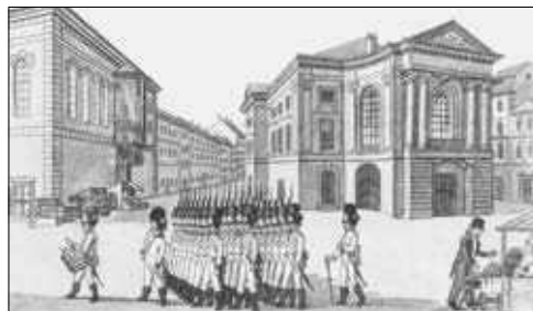
Das Ständetheater in Prag, Ort der Uraufführung des Don Giovanni am 29.10.1787