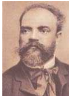
Antonín Dvořák (Foto um 1891)

Der erste Satz der Sinfonie eröffnet mit einem g-Moll-Einleitungsthema, das feierlich choralartig klingt. Es ist dunkel instrumentiert. Wie ein Motto erklingt es jeweils vor jedem der klassischen Formabschnitt. So kehrt es also vor der sogenannten Durchführung und auch der Reprise wieder, ohne dabei weiterverarbeitet, sprich motivisch einbezogen zu werden. Das zweite Thema hingegen wird nicht von