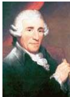
Joseph Haydn Gemälde von Thomas Hardy, 1791